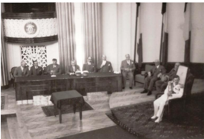
Foto 7. Regele Carol al II-lea și membri ai guvernului român pe scena Colegiului academic clujean, ascultând un discurs.