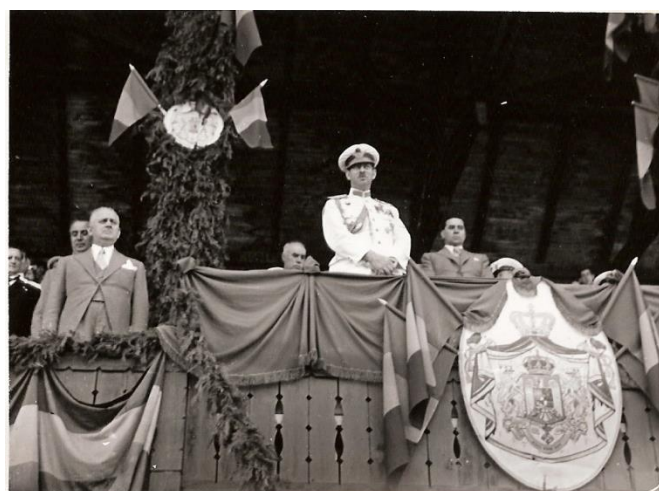
Foto 12. Regele Carol al II-lea în loja de onoare, în tribuna stadionului sportiv din Cluj – iunie 1937.