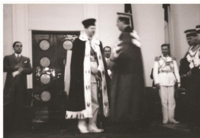
Foto 10. Rectorul Ștefănescu-Goangă vorbind cu regele Carol al II-lea, în toga de DHC - prim plan.