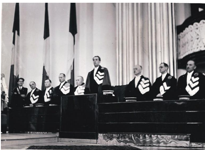
Foto 5. Senatul Universității clujene, în robe de ceremonie, la decernarea titlului de Doctor Honoris Causa Regelui Carol al II-lea.