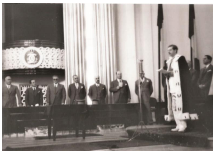
Foto 11. Regele Carol al II-lea, în mantie de ceremonie, citind discursul de acceptare a titlului de DHC.