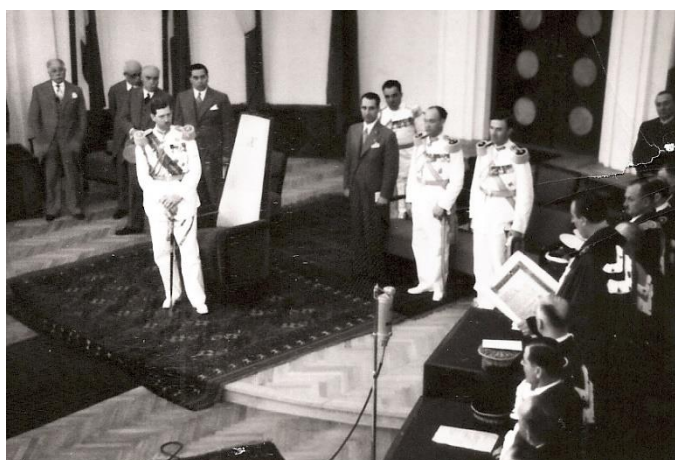
Foto 9. Rectorul Ștefănescu-Goangă citind diploma de DHC a regelui Carol al II-lea, în fața Majestății Sale.