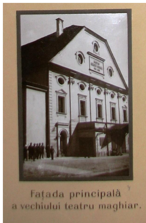
Foto 2. Imaginea fostului Teatru al orașului Cluj, clădire în locul căreia s-a construit Colegiul Academic.