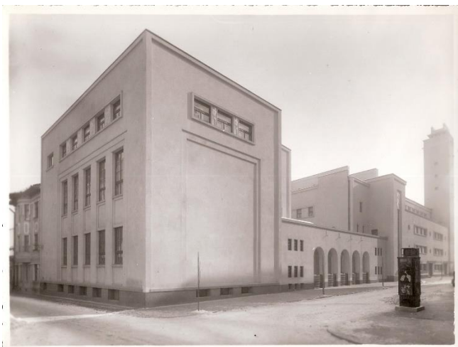
Foto 3. Fotografie de epocă a Colegiului Academic Clujean, ridicat în perioada 1934-1937.