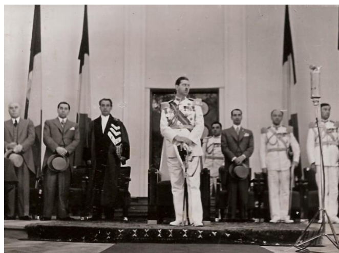
Foto 6. Regele Carol al II-lea, rectorul Ștefănescu-Goangă, alte personalități, pe scena Colegiului academic clujean.